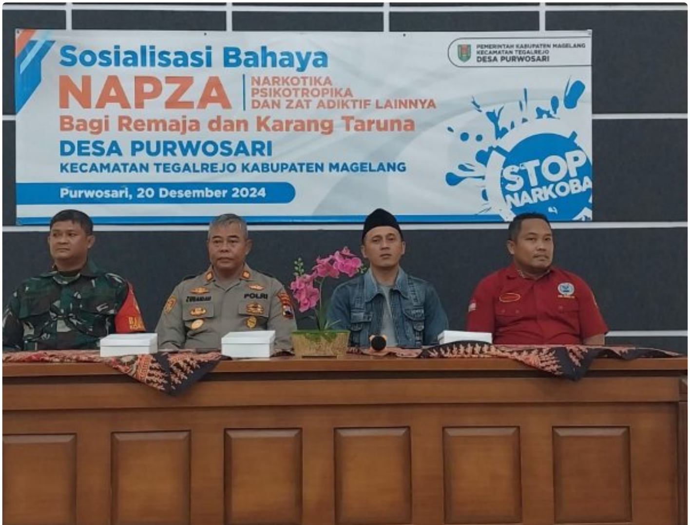
(Foto Dokumen) : Kegiatan sosialisasi bahaya narkoba dan kenakalan remaja

MAGELANG - Anggota Koramil 09/Tegalrejo bersama Polsek setempat dan anggota BNN memberikan sosialisasi tentang bahaya narkoba dan kenakalan